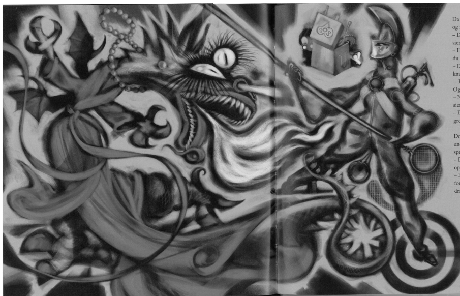
Il. 2. Walka ze smokiem