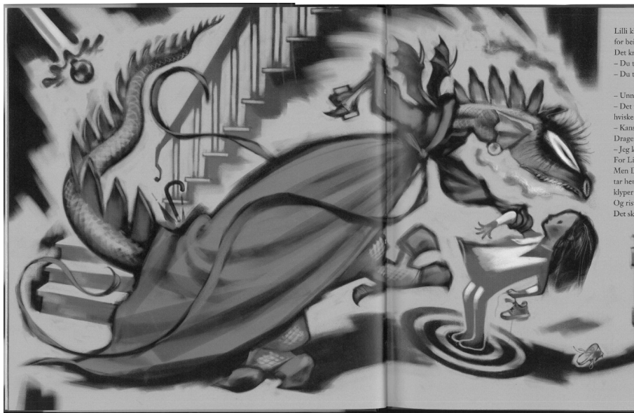
Il.1. Przemoc matki

Gdy do domu przybywa pogromczynie smoków i rozpoczyna się proces symbolicznej psychoterapii, w „umysło-obrazie” przybiera on postać walki średniowiecznych rycerzy ze smokami (Il. 2).