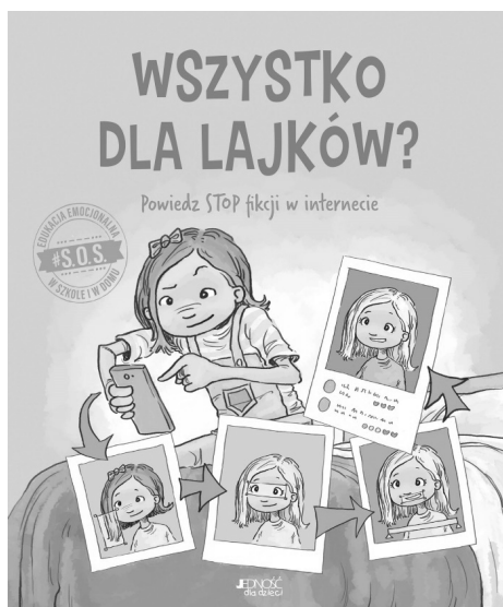
Il. 2. Jenifer Moore-Mallinos, il. Jon Davis, Wszystko dla lajków? Powiedz STOP fikcji w Internecie , tłum. Joanna Olejarczyk, Kielce, Wydawnictwo Jedność, 2022: okładka.

W serii wydawniczej S.O.S. również dominuje schematyczność. I tym razem tytuł znajduje się powyżej ilustracji – „scenki” zapowiadającej omawianą w książce problematykę. Schematyczność formuły artystycznej jest umotywowana podkreśleniem jedności serii mającymi związek z aspektami ekonomicznymi, tj. promocja i sprzedaż (il. 2).