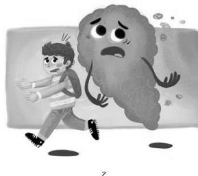
Il. 3. Magdalena Młodnicka, il. Beata Pękalska, Strach ma wielkie oczy: książka, która dodaje odwagi , seria: Wielkie problemy małych dzieci , Kielce, Wydawnictwo Jedność, 2020.

Czasami, kiedy się boję, wstrzymuję oddech i zamieram w bezruchu albo – wręcz przeciwnie – uciekam ile sił w nogach.